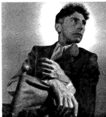
Jean Cocteau (1889-1963)

A dividere fin dall'inizio i due amici, nonostante l'ammirazione che professano l'uno per l'altro, è però la loro concezione della let-